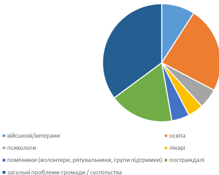
Рис. 2. Розподіл проектів за сферою / цільовою групою

Цільова аудиторія - шкільні педагоги, визначена менш, ніж в 25 % проаналізованих проектах. При цьому основними темами, якими опікуються на даний час українські та міжнародні організації у сфері освіти, є такі: